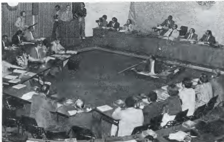
Un "projektbureau" lo mester prepará e struktura di gobierno nobo.

E komishon ta di opinion ku un desentrali-